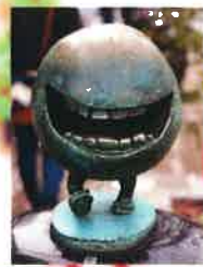
鬼太郎ロードの べとべと君